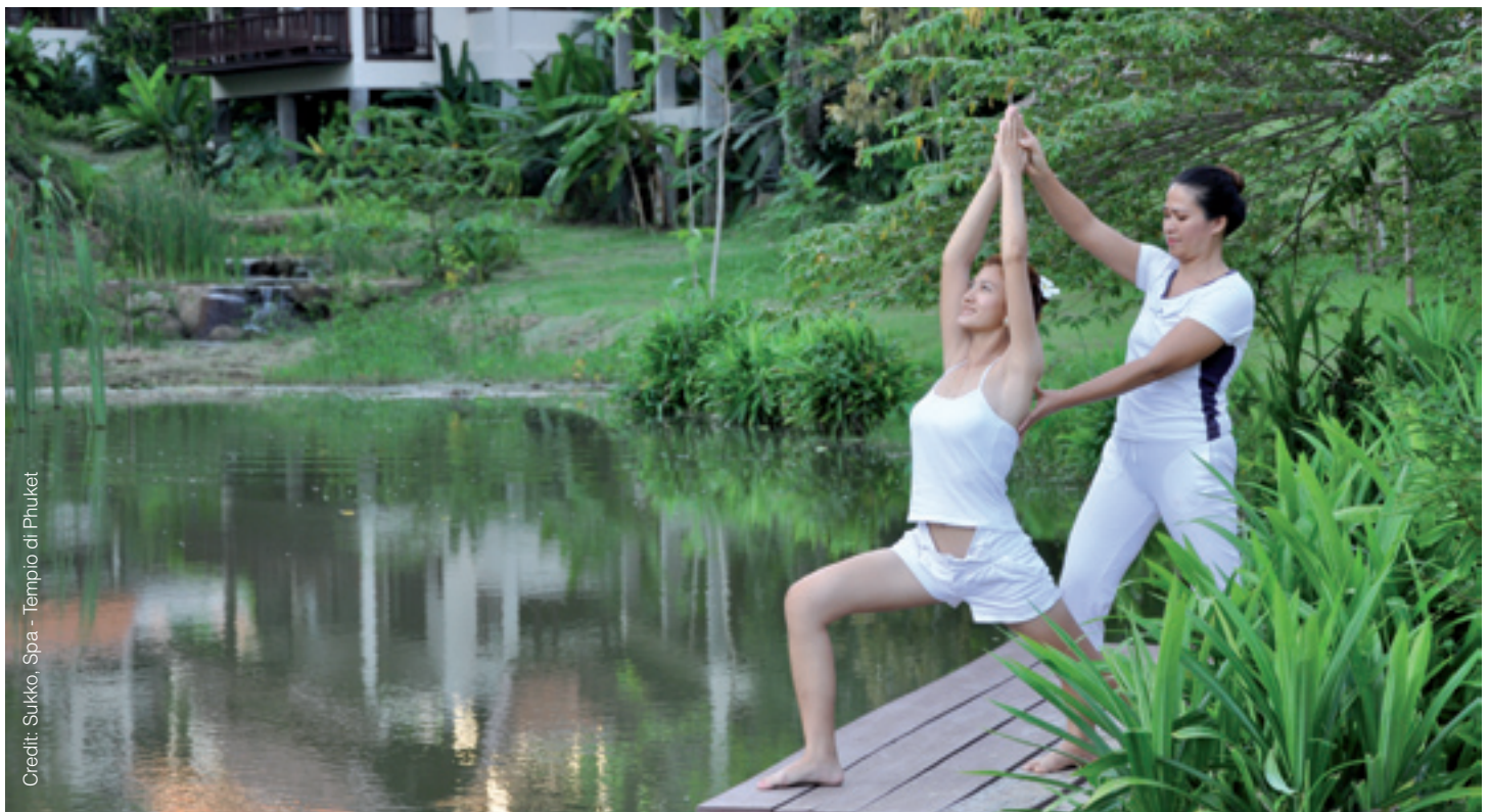
Spa - Tempio di Phuket

Il sorriso ieratico e saggio del Buddha è una linea sinuosa delineata nella giada, ma il sorriso della divinità felice è un'irrefrenabile melodia di gioia sulle note di una dentatura perfetta. In Thailandia le cure dentistiche sono da tempo all'avanguardia. Da un trattamento sbiancante laser professionale, all'implantologia più complessa, dalla semplice pulizia dentistica alla ricomposizione estetica della bocca, tutto si può prendere in considerazione in un soggiorno vacanza. Ritroverete il sorriso in un ambiente sicuro dalle sofisticate tecnologie come quello della Dental Clinic del Phyathai 1 Hospital o del Bumrungrad International Hospital. Il prezzo è competitivo. Buddha moderatio docet.